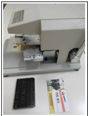
プレートをプレス機にセット